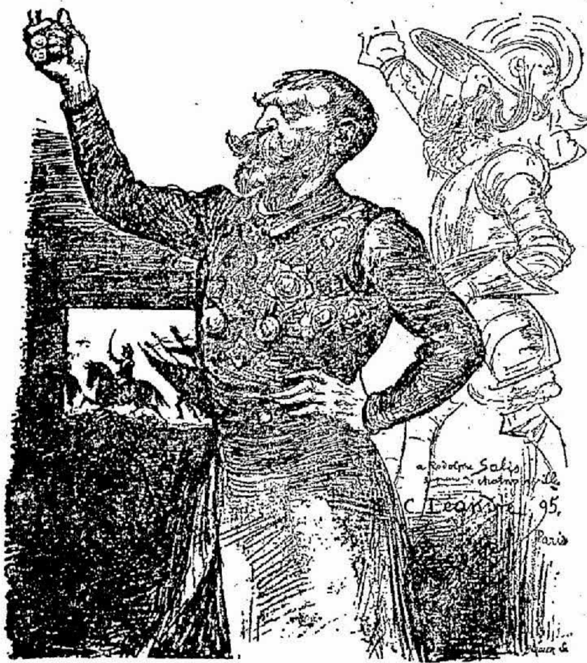
Rodolphe Salis, par Léandre.