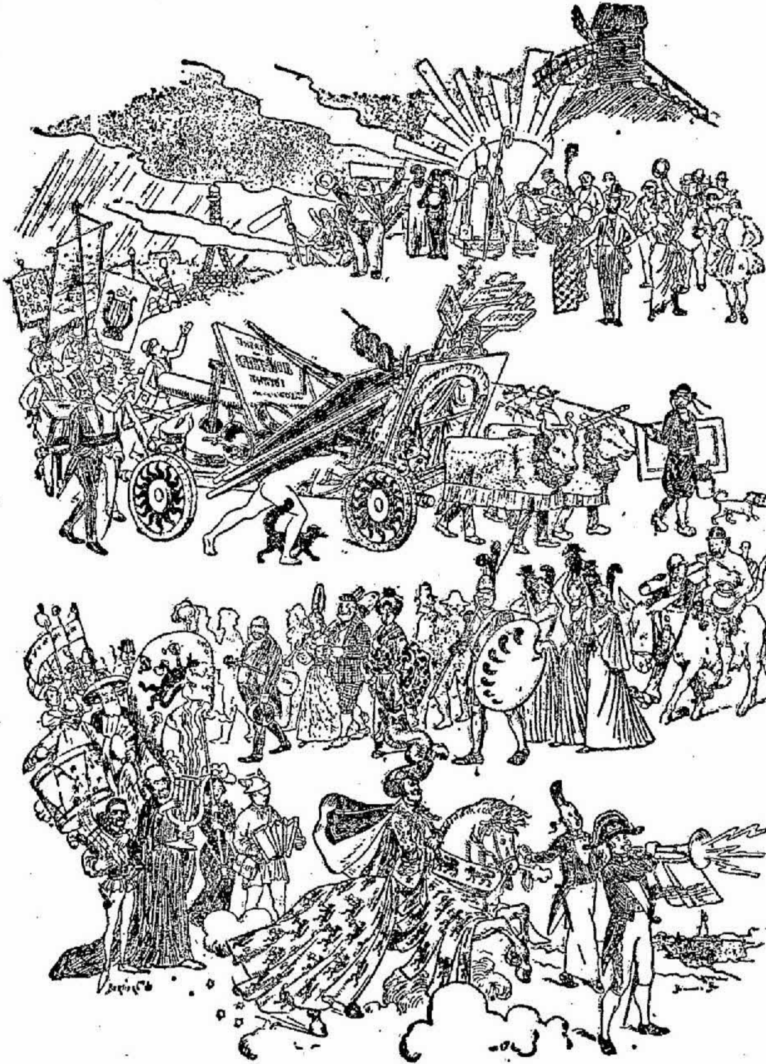
Le Déménagement Solennel du Chat-Noir, par Fernand Fau.